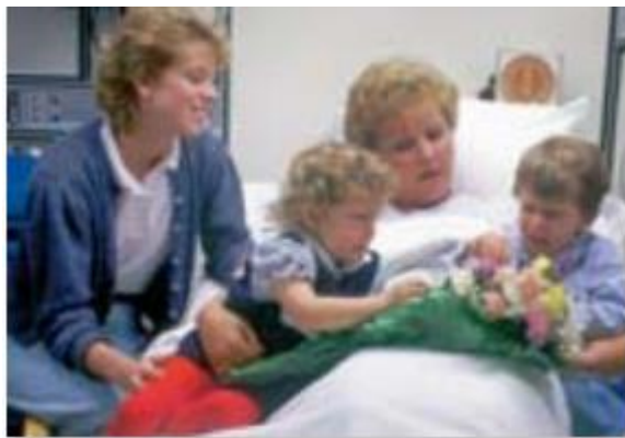
คือ “ชายใหม่” (หรือ “หญิงใหม่”)

หนังสือเล่มสุดท้ายของพระคัมภีร์พยากรณ์ว่ามนุษย์ชั่วร้ายกำลังถูกโยนลงไปนบิงไฟ “จากนั้นสัตว์ร้ายก็ถูกจับพร้อมกับผู้เผยพระวจนะเท็จซึ่งทำสัญลักษณ์ต่อหน้าเขา . . . สองคนนี้ถูกทิ้งให้ไหม้ชีวิตในบิงไฟที่ลุกโชนด้วยกำมะถัน” (วิวรณ์ 19:20) จะเกิดอะไรขึ้นกับร่างกายของมนุษย์ที่ถูกโยนทิ้งเป็นลงในหม้อไฟขนาดใหญ่? พวกมันถูกเผาไหม้และถูกบริโภคนหมด