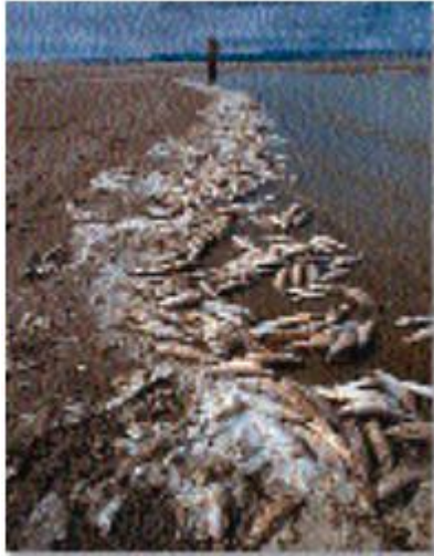
มลภาวะในอากาศ ดิน

และน้ำที่เพิ่มขึ้นเป็นภัยคุกคามต่อสุขภาพของมนุษย์และแม้กระทั่งชีวิตในหลายพื้นที่